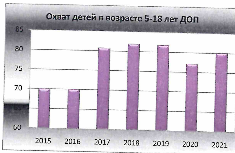
Рисунок 3 – удельный вес численности детей, получающих услуги дополнительного образования, в общей численности детей в возрасте 5-18 лет, в %.

Количество педагогических работников дополнительного образования, прошедших аттестацию в 2021 году, составило 2 человека: по должности «методист» - 1 человек на I квалификационную категорию, по должности «тренер-преподаватель» - 1 человек на высшую квалификационную категорию. Общее количество педагогических работников, имеющих квалификационную категорию или аттестованных на соответствие занимаемой должности по состоянию на 1.01.2022 года составляет 12 человек: