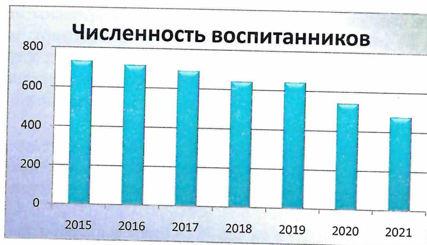
Рисунок 1 – численность воспитанников образовательных организаций, осуществляющих образовательную деятельность по образовательным программам дошкольного образования, в чел.

В МБДОУ «Детский сад №5» работает Консультационный центр (далее – КЦ), осуществляющий оказание методической, психолого-педагогической, диагностической, консультативной помощи родителям (законным представителям) с детьми дошкольного возраста, в том числе для детей раннего возраста и детей с особенностями в развитии.